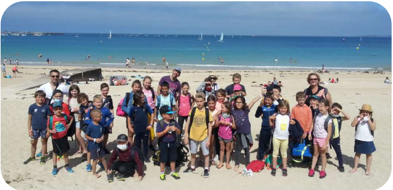
Les Brusvily Kids ! sur la plage de Saint-Cast-le-Guildo.