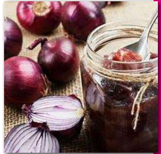
Pour 4 à 5 pots de 225g